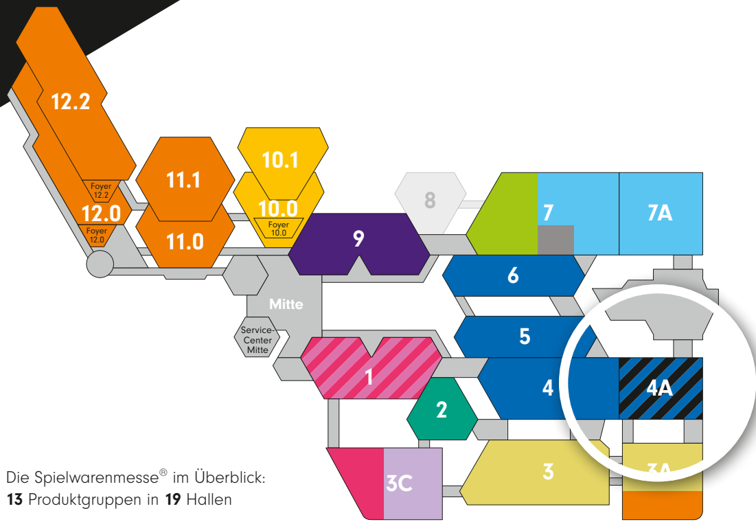
Die Spielwarenmesse® im Überblick: 13 Produktgruppen in 19 Hallen